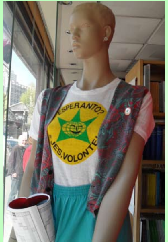
transsendis Izabel Lamirested'