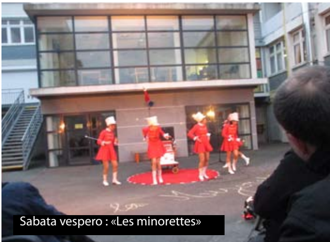
Sabata vespero : «Les minorettes»