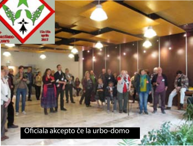
Oficiala akcepto ĉe la urbo-domo