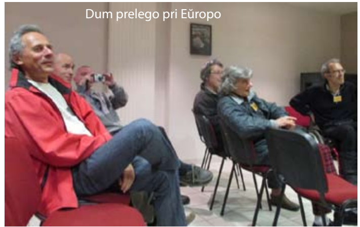
Dum prelego pri Eŭropo