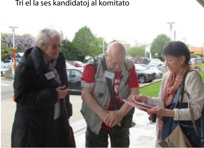
Tri el la ses kandidatoj al komitato