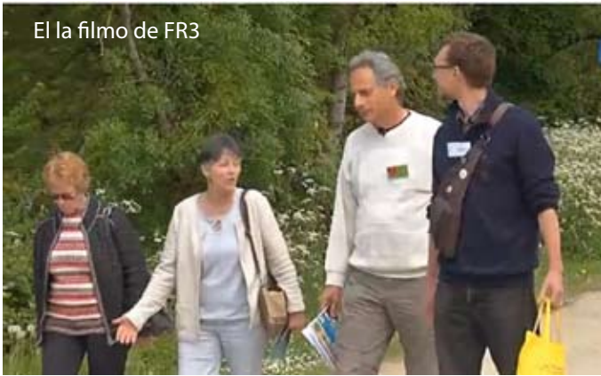
El la filmo de FR3