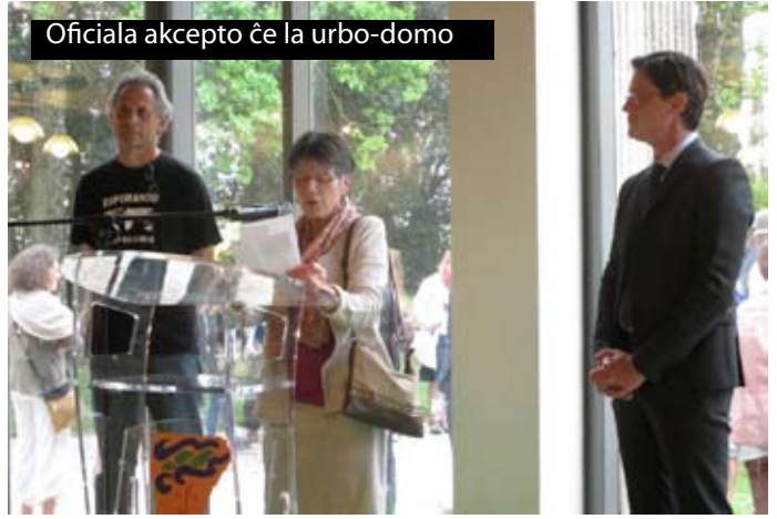
Oficiala akcepto ĉe la urbo-domo