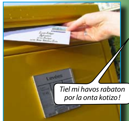
Ĝin poŝte sendu. (L' poŝtmarkon ni duoble repagos!)