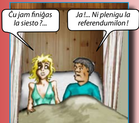
Mallongigu vian sieston je kelkaj minutoj...