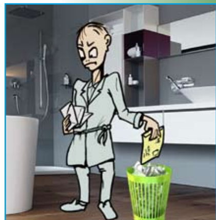
Indiferenta kaj/aŭ dubema...