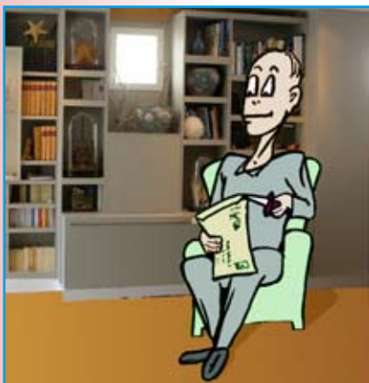
Saĝa kaj/aŭ singarda...