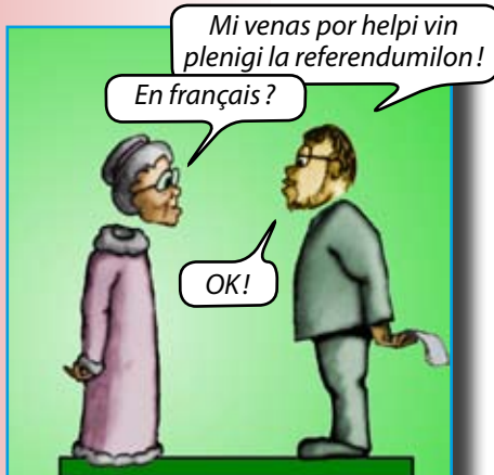
Plenigu la referendumilon (ene de ĉi numero)