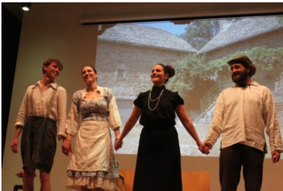
Fine de la teatraĵo Karotkapo (Vito, Libnjo, Flonjo, Ŝtonĉjo)