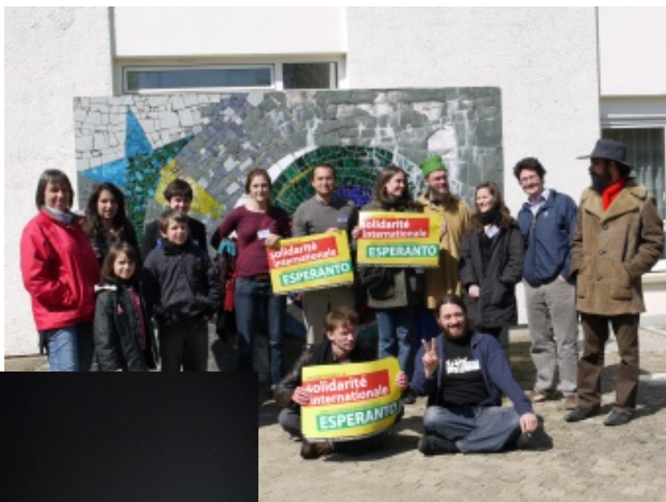
Komuna foto (de la gejunuloj!)